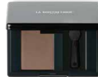
Magic Shadow 47 Smooth Cappuccino