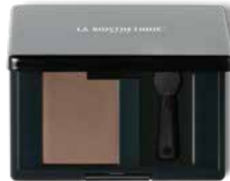
Magic Shadow 47 Smooth Cappuccino

«Der Eyecatcher in diesem Look ist der True Color Lipstick Pink Salmon. Großzügig auftragen und bis in die Kontur ausmalen.»