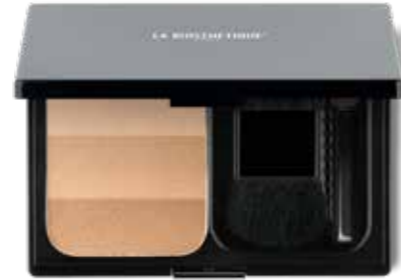
Highlighter-Trio Rose oder Gold